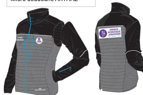
Micro doudoune ARTHAZ