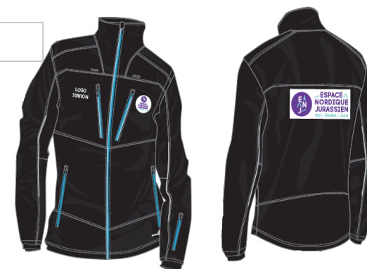
Soft shell AUMOND

Le prix est dégressif en fonction des quantités de vestes commandées.